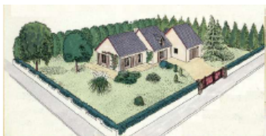
Plutôt qu'une haie monospécifique uniforme sur muret ...