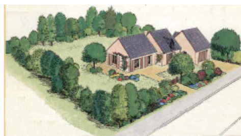
... préférer une haie panachée d'essences champêtres locales noyant le grillage de protection.