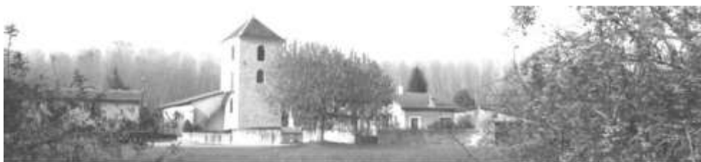
Vue de l'église de Chavannes