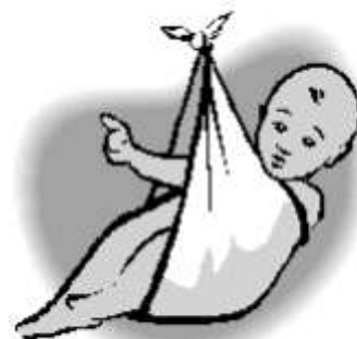
Cinq naissances en 2001