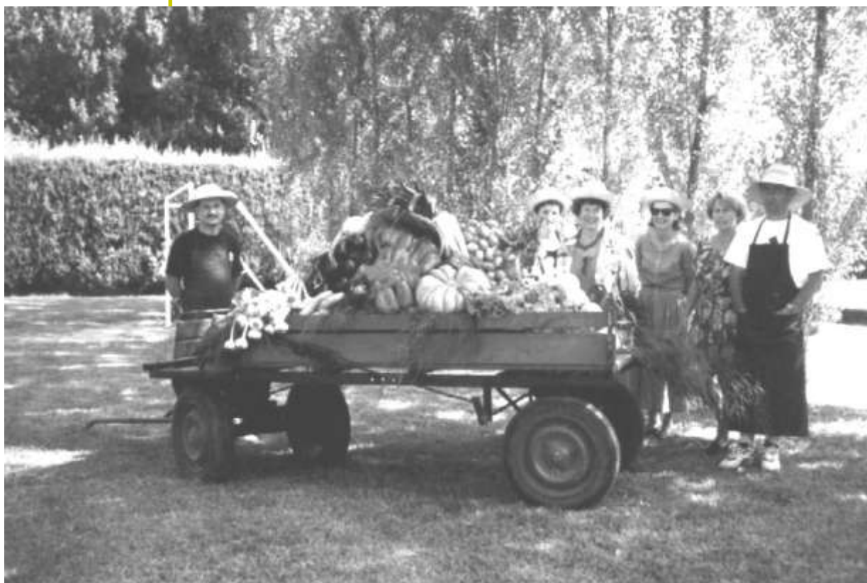
Photo de la fête du légume