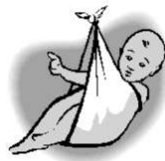
Six naissances en 2003