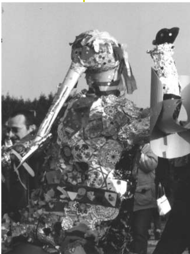
< Mr Carnaval 2003