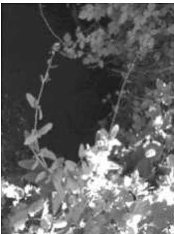
Scrofulaire des ombrages

Le marais mouvant n'est pas accessible à pied. Il présente un danger réel, le sol formant de véritables sables mouvants (un chasseur s'y serait embourbé jusqu'aux épaules).