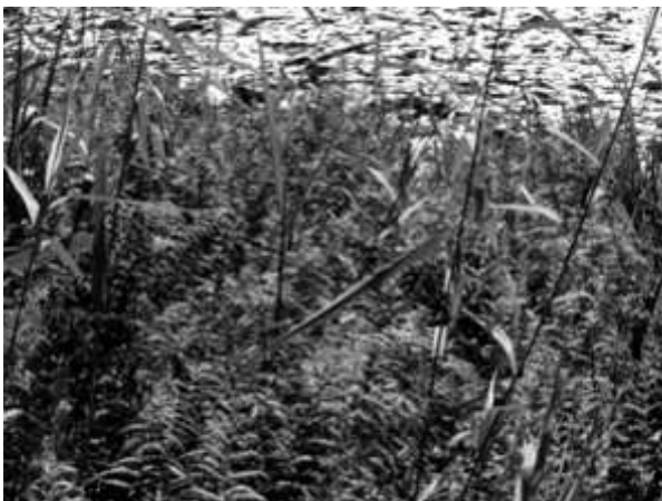
Fougère des marais (protégée régionalement)