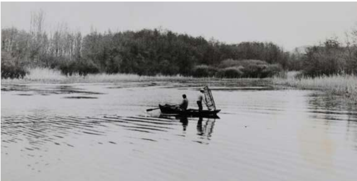
Pêche sur l'Étang dans les années 1960