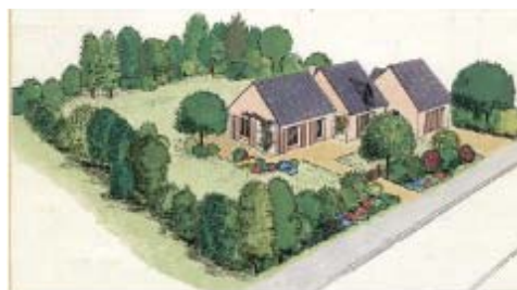
... préférer une haie panachée d'essences champêtres locales noyant le grillage de protection.