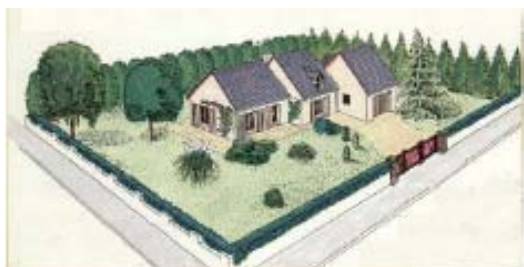
Plutôt qu'une haie monospécifique uniforme sur muret ...